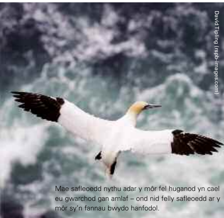
Mae safleoedd nythu adar y môr fel huganod yn cael eu gwarchod gan amlaf – ond nid felly safleoedd ar y môr sy'n fannau bwydo hanfodol.

Yn y DU, mae'r Llywodraeth wedi datblygu ei chanllawiau ei hun ar gyfer dethol AGA. Mae hyn wedi arwain at rwydwaith AGA llai o lawer na'r hyn a ddynodwyd gan rwydwaith BirdLife o Ardaloedd Pwysig ar gyfer Adar yn y DU.