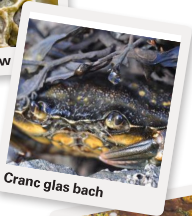
Cranc glas bach