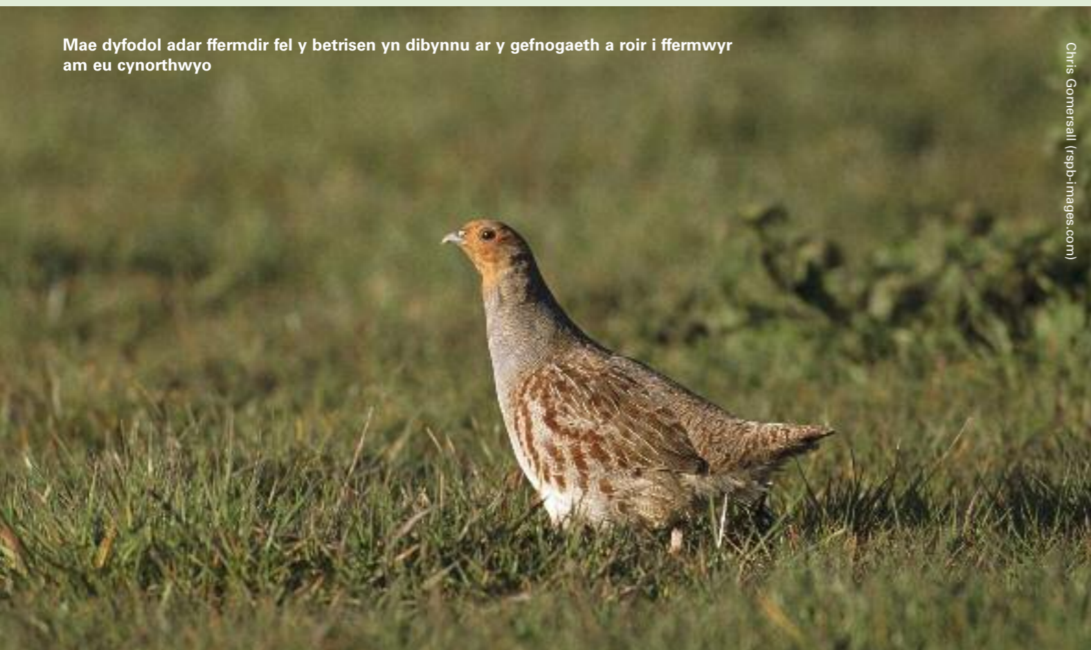
Mae dyfodol adar ffermdir fel y betrisen yn dibynnu ar y gefnogaeth a roir i ffermwyr am eu cynorthwyo

Os hoffech wybod mwy am y project hwn cysylltwch â Stephen Bladwell ar stephen.bladwell@rspb.org.uk neu ffoniwch 01248 672850.