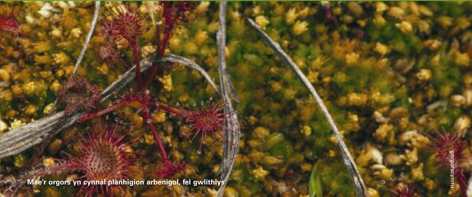
Mae'r orgors yn cynnal planhigion arbenigol, fel gwllithlys