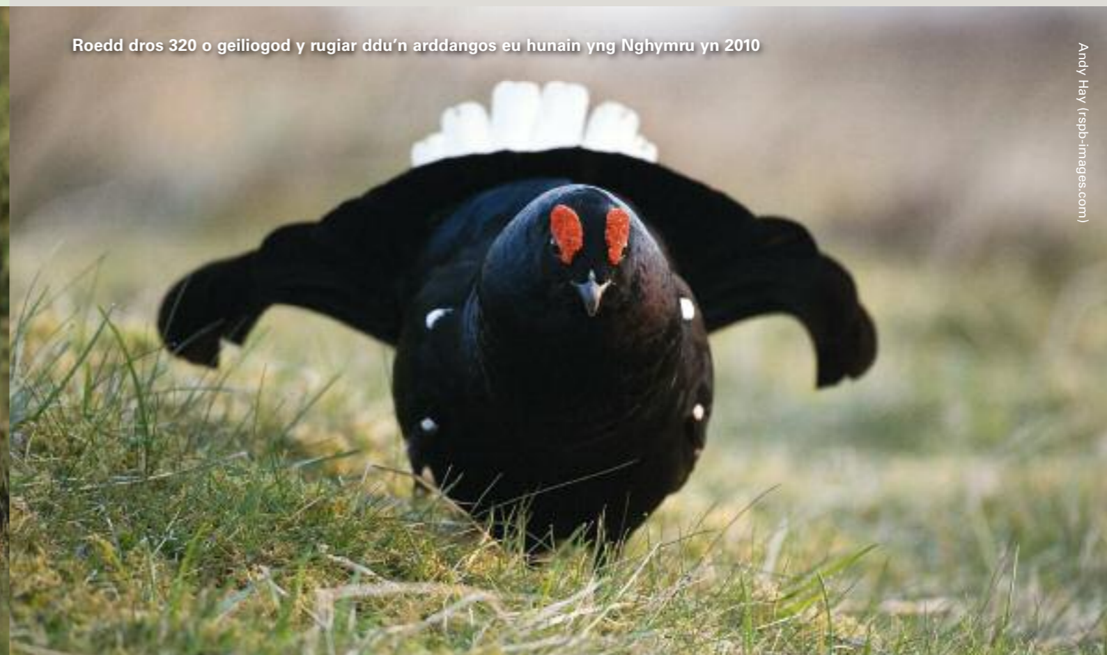
Roedd dros 320 o geiliogod y rugiar ddu'n arddangos eu hunain yng Nghymru yn 2010