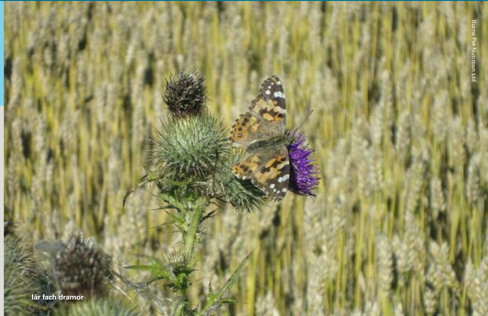
lâr fach dramor

Am ragor o wybodaeth, ewch i wefan Penlan i weld eu blogiau cadwraeth ar http://burnspet.co.uk