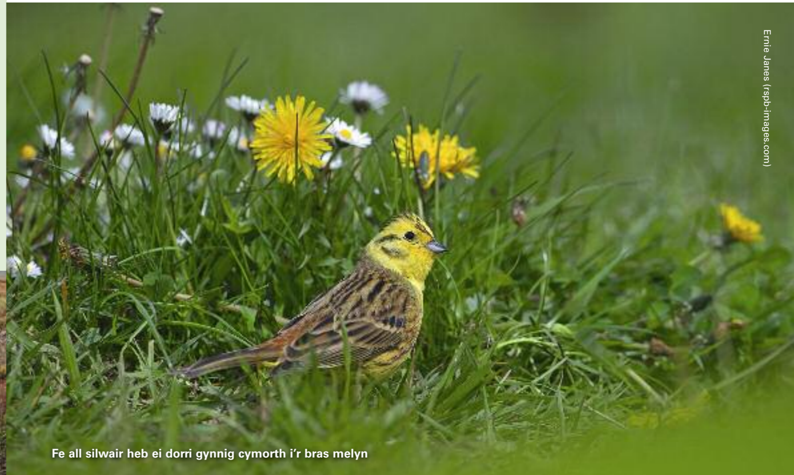
Fe all silwair heb ei dorri gynnig cymorth i'r bras melyn

Am ragor o wybodaeth am y project neu am wybodaeth ynglŷn â sut i helpu adar a bywyd gwyllt ar eich fferm, cysylltwch â Lesley Fletcher ar lesley.fletcher@rspb.org.uk neu ar 07776 453360.