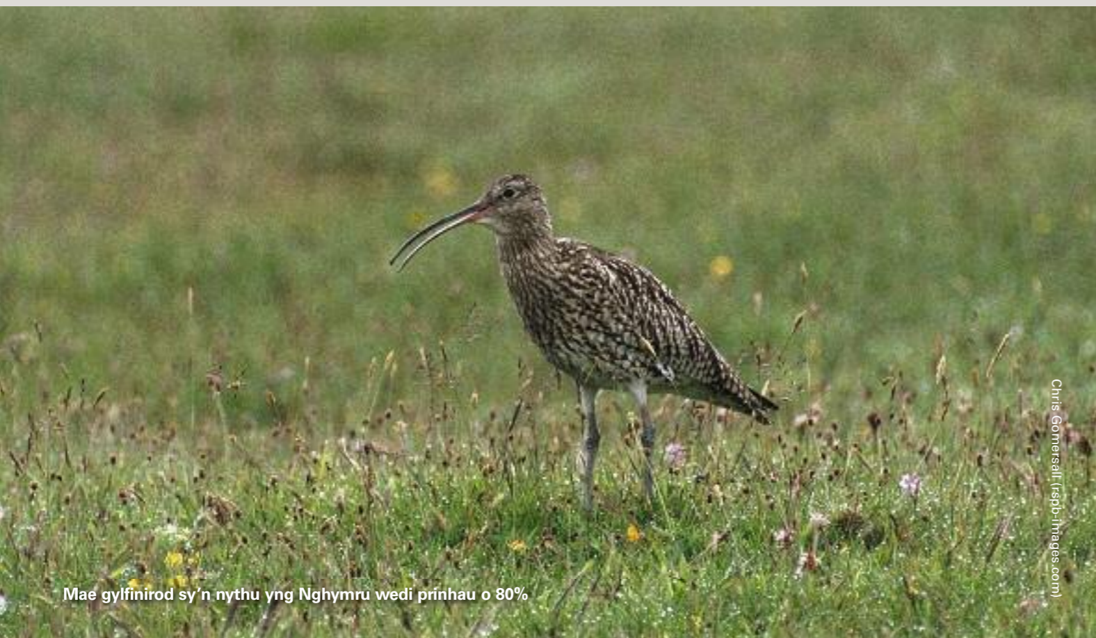
Mae gylfinirod sy'n nythu yng Nghymru wedi prnhau o 80%

Ewch i www.rspb.org.uk/birdwatch am fwy o wybodaeth.