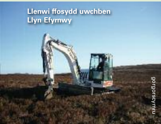
Llenwi ffosydd uwchben Llyn Efyrynwy