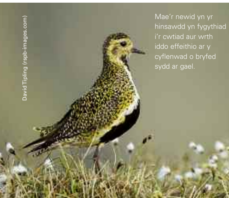
Mae'r newid yn yr hinsawdd yn fygythiad i'r cwtiad aur wrth iddo effeithio ar y cyflenwad o bryfed sydd ar gael.