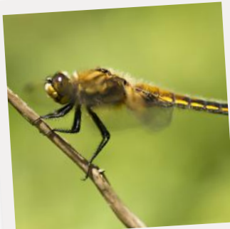
Gwas y neidr