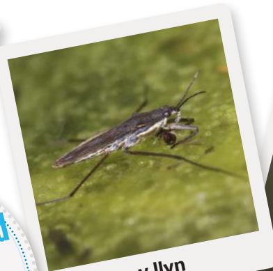
Sgleftriwr y llyn

Gweithgaredd Ysgrifenna atom ni i ddweud beth rwyf ti wedi dod o hyd iddo.