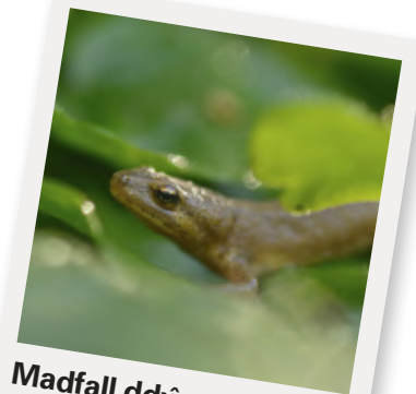
Madfall ddŵr gyffredin